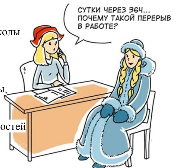
ПРОПУСКИ В ТРУДОВОМ СТАЖЕ НАВЕРНЯКА ВЫЗОВУТ ВОПРОСЫ

Все возникшие вопросы уменьшают шансы на то, что работодатель пригласит вас на собеседование. А если пригласит - обязательно задаст эти вопросы.